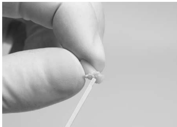
Abb. 5 – Nicht polymerisiertes Material wird vom Teststopfen entfernt