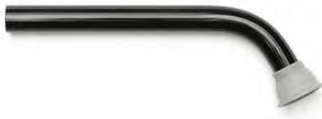
Abb. 1 Schutzkappe

Für die Behandlung von Seitenzähnen verwenden Sie eine Schutzkappe als Lichtschutz: