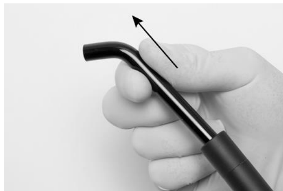
Abb. 3 – Herausziehen des Lichtstabs aus dem XO ODONTOCURE Handstück

Autoklavieren Sie den Stab und die Schutzkappe (AP-917) bei 134 ° C voneinander getrennt.