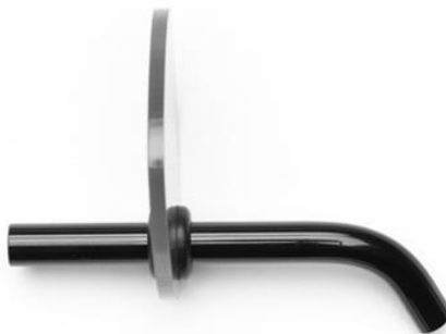
Abb. 2 Lichtschild

Für die Behandlung von Frontzähnen verwenden Sie das Lichtschild: