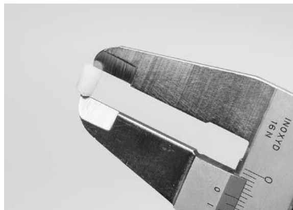
Abb. 6 – Dickenmessung des Teststopfens