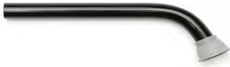
Figur 1 – Ändskydd

Vid härdning av bakre tänder ska ett ändskydd användas som ljusskärm: