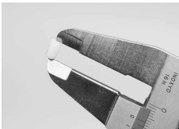
Figur 6 – Provbitens djup mäts