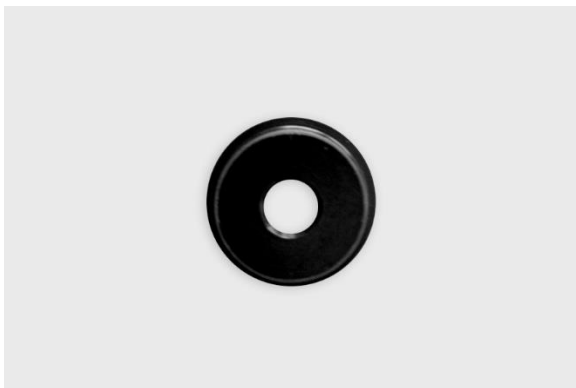
Figur 4 – Testtrapp